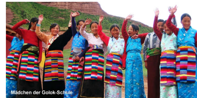
Mädchen der Golok-Schule

Förderverein ASIA Deutschland e.V., Geschäftsstelle c/o Gisela Auspurg, Königswieser Str. 2, 82131 Gauting Tel. 089 - 127 630 32, info@asia-ngo.de