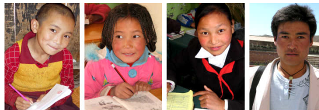
DORDEN DERGE Grundschule

Mittlerweile hat im Rahmen einer neuen allgemeinen Schulpflicht die chinesische Regierung auch in den abgelegenen tibetischen Regionen im Norden und Osten des tibetischen Hochplateaus die schulische Grundversorgung verbessert. Das ASIA-Patenschaftsprojekt ist im Wandel begriffen von einem Projekt, das bisher den „Ärmsten der Armen“ überhaupt einen Schulbesuch ermöglicht hat, zu einem Projekt, das sich um eine Verbesserung der Ausbildung bemüht: angefangen von der Unterrichtsqualität, z.B. verbesserter Englischunterricht, bis hin zur Lebensqualität für die Schüler, z.B. Verbesserung von Ernährung, Trinkwasser, Hygiene, medizinischer Versorgung und Umweltbewusstsein.